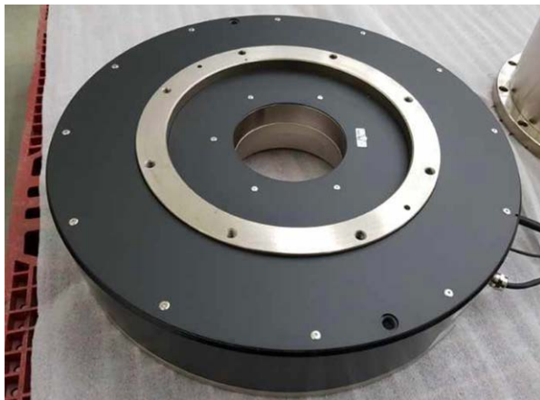
저스택 JTR49 시리즈 DDR 모터(Ø490 mm OD)

ATOM 엔코더의 RCDM 로터리 스케일은 일체형 유리 디스크로, 단일 레퍼런스 마크, 옵티컬 정렬 링과 함께 디스크면에 직접 스케일 눈금이 새겨져 있습니다. 옵티컬 정렬 링을 사용해 디스크를 정확하게 정렬하여 편심을 최소화하고 설치 정확도를 높일 수 있습니다.